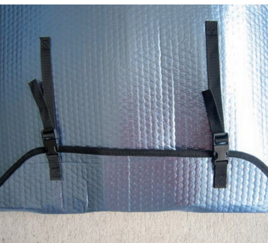
Die Verschlüsse sind äußerst stabil.