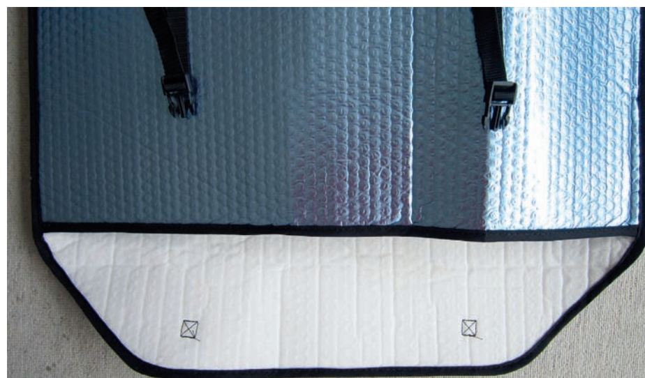
In der Innenklappe ist die Innenbeschichtung aus Softvlies sehr gut zu erkennen.